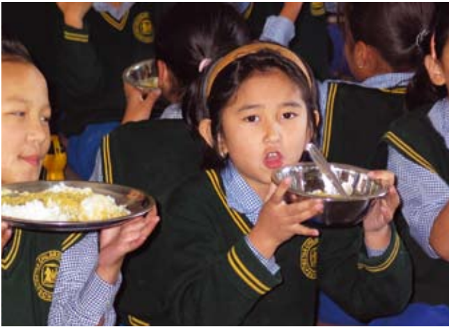
Het dagelijkse voedsel van de kinderen: rijst met dal

Het sponsorbedrag dat SHAT maandelijks per kind overmaakt aan de Tibetan Children's Villages is sinds de invoering van de Euro in 2002 niet verhoogd en sinds die tijd vastgesteld op € 25 per maand. In de loop van de jaren zijn de prijzen, net als in Nederland, ook in India sterk gestegen. Met name de prijs voor rijst en dal (linzen), het voedsel dat de kinderen dagelijks nuttigen, is in India verdubbeld. Ook de energiekosten zijn fiks gestegen. Daarom is de maandelijkse bijdrage van € 25 niet meer toereikend.