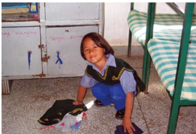
Tibetaans meisje voor haar kledingkastje

Wij willen u nogmaals hartelijk danken voor uw ruimhartige betrokkenheid en steun, mede namens de kinderen in de TCV's!