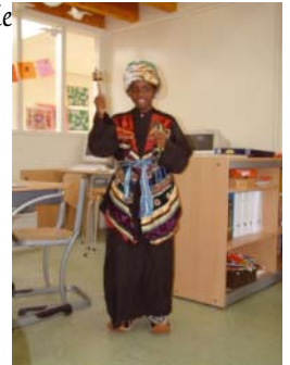
Verkleed met de spullen uit SHAT's leskist

"Een tijdje geleden zag ik een advertentie voor een leskist over Tibet en dacht dat dat wel heel leuk zou zijn voor mijn groep 7. Aldus zijn mijn collega en ik het Tibet project gestart. De leskist is zo gevarieerd dat er voldoende keuzemogelijkheden zijn.