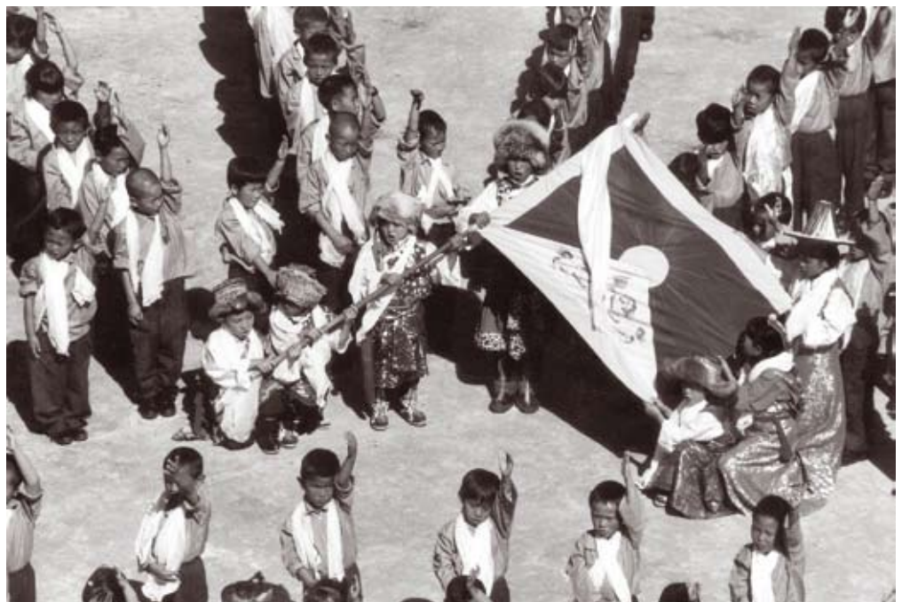
Kinderen in Tibetaanse kleding met vlag