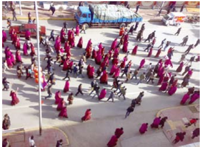
Monniken protest in Labrang klooster in april 2008

Na protesten in Lhasa in 1987 heeft de toen verantwoorde- lijke man voor Tibet, de huidige president Hu Jintao, met zeer harde hand elk verzet de kop ingedrukt. Afbeeldingen van de Dalai Lama werden verbannen uit kloosters en van