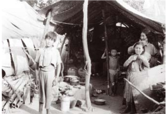
Van echte opvang was in 1959 nog geen sprake: van lappen gemaakt tentendak...

De Dalai Lama heeft een afvaardiging naar Peking gestuurd om over de ontstane situatie te onderhandelen. Deze delegatie heeft de uiteindelijke versie van een tot stand gekomen verdrag niet mogen afstemmen met de Tibetaanse regering of de Dalai Lama. Zonder die instemming is er in 1951 in Peking dus een verdrag gesloten tussen China en Tibet. In dit Zeventien Punten Verdrag werd vastgelegd hoe de verhouding zou zijn tussen Chinezen en Tibetanen. Bestuur over de regio zou in Tibetaanse handen blijven met volkomen vrijheid voor religieuze en culturele aangelegenheden. In een ijltempo werden wegen aangelegd en vliegvelden gebouwd door de Chinese militairen en kwamen er steeds meer Chinese troepen naar Tibet.