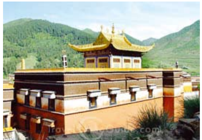
Het bekende Labrang klooster

Vandaag vormen de Tibetanen, met ongeveer 130.000 mensen, de grootste vluchtelingengroep ter wereld, die erin geslaagd is om met behoud van eigen cultuur en religie min of meer op eigen benen te gaan staan.