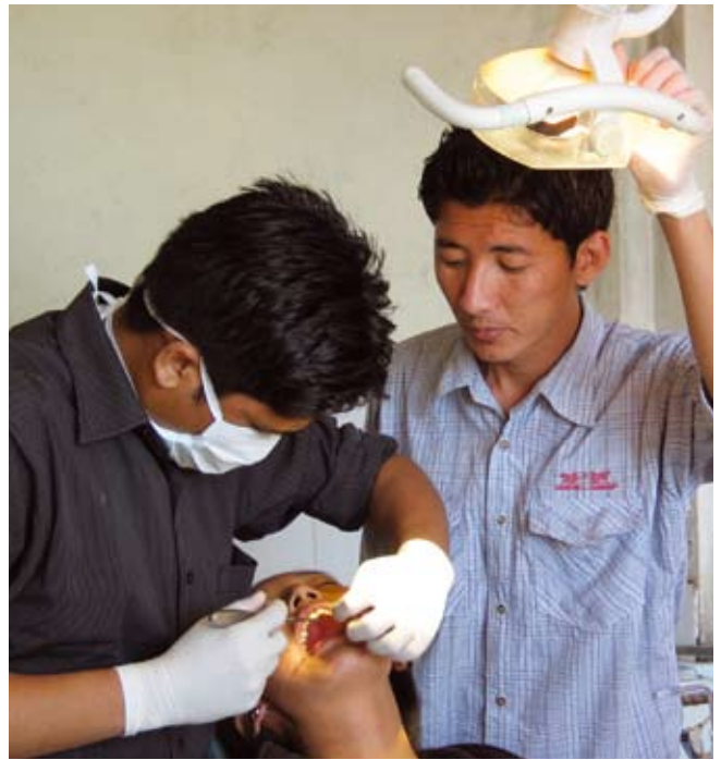
De met een beurs van SHAT in 2005/2006 opgeleide tandtechniker nu aan het werk in het Delek Hospital

De stichting kan mede dankzij de financiële hulp van donateurs een bijdrage leveren aan uiteenlopende projecten. In het verslagjaar is ruim € 80.000 aan projecthulp toegekend. Vooral onderwijs neemt hierbij een belangrijke