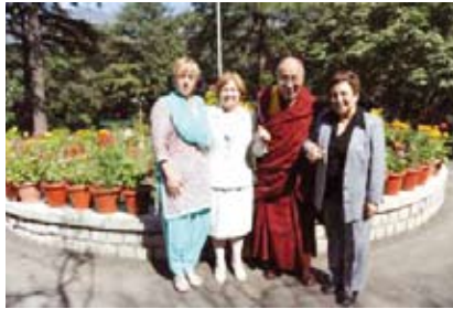
De Dalai Lama samen met de laureaten

Afgelopen oktober waren drie Nobel Prijs winnaars voor enkele dagen in Dharamsala op initiatief van de Foundation for Non-Violent Alternatives. Allemaal vrouwen, Mairead Macguire, één van de Ierse vrouwen die