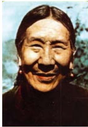
De moeder van de Dalai Lama, Gyalyum Chenmo, grote Moeder

Ook SHAT werd hartelijk bedankt voor de financiële bijdrage aan de toiletten voor deze nieuwbouw. Vier toiletten voor de jongens en vier voor de meisjes met aan elke kant ook vier wasbakken. Alles degelijk, praktisch en duurzaam. SHAT wordt ook dank gebracht voor de vele hulp die al vanaf 1963 aan Tibetaanse kinderen gegeven is.