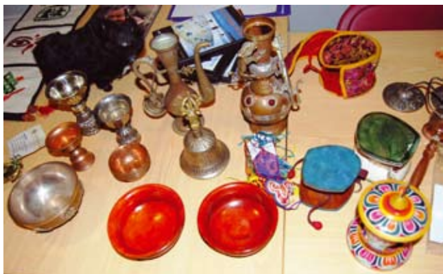
Materiaal uit de leskist van SHAT

Ook in het nieuwe (school) jaar kunt u weer volop gebruik maken van de mogelijkheid de Tibet-leskist van SHAT te lenen voor gebruik op lagere scholen.