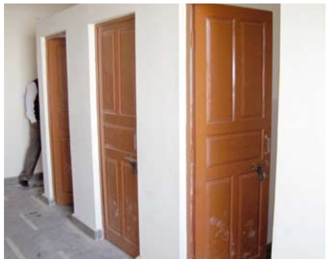
De nieuwe toiletten: schoon, degelijk, praktisch en duurzaam

De school is nu een volledige TCV school geworden en het oudercomité wordt opgeheven als alles afgehandeld is. De school is heel belangrijk voor ouders met kleine kinde-