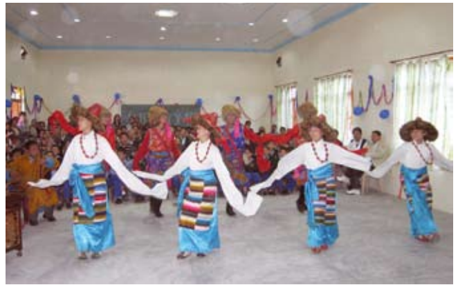
Feestelijkheden met muziek en dans door de kinderen

Na het officiële gedeelte wordt er Tibetaanse muziek gemaakt, gezongen door de leerlingen en jongelui voeren enkele Tibetaanse dansen op. Een feestelijk gebeuren!