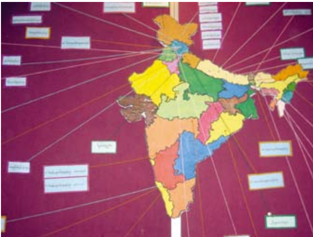
India met alle TCV's

Hoewel India veel heel arme mensen heeft, gaf India ons land om te bebouwen voor onze overleving en om huizen en scholen op te bouwen. Deze scholen zijn uitgerust met goede schoolsystemen en wij kunnen onze eigen manier van doen volgen. Dat samen geeft ons de hoop die wij nodig hebben op een terugkeer naar een vrij Tibet!