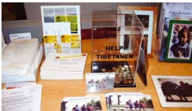
De stand van SHAT

De Tibetdag Houten wordt op zaterdag 16 jan. 2010 gehouden in het Sociaal Cultureel Centrum De Grote Geer (open vanaf 10.00 uur, toegangskarten zijn Euro 3) SHAT zal aanwezig zijn met een stand.