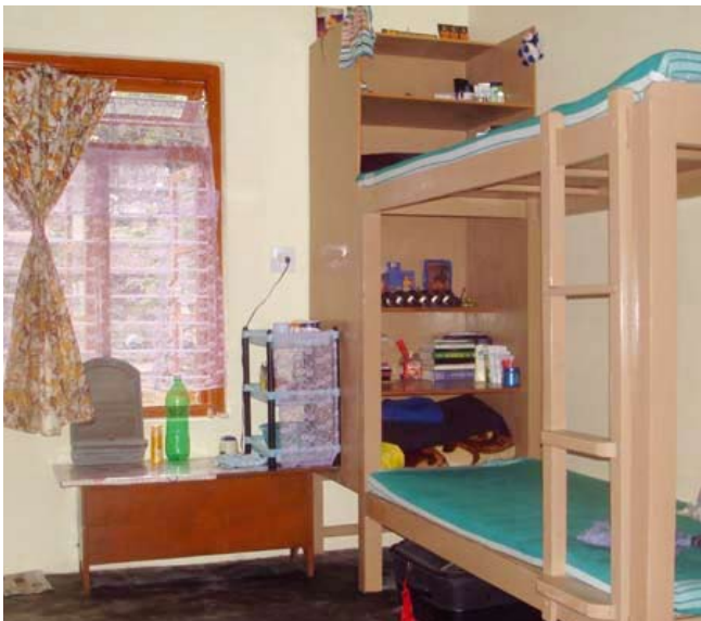
Kerstactie voor bedden in de hostels van TCV Bylakuppe

SHAT organiseert één keer per jaar een speciale kerstactie, om extra sponsorgeld in te verzamelen ten behoeve van een specifiek project voor de Tibetaanse kinderen in de Tibetan Children's Villages in India. In het kinderdorp Bylakuppe zijn twee huizen, zogenaamde hostels, bijgebouwd. Eén voor 20 meisjes en één voor 20 jongens in de leeftijdscategorie vanaf 16 jaar. Voor deze twee uitbreidingen moeten 40 bedden aangeschaft worden. In totaal kost deze aanschaf, inclusief matrassen en linnengoed, € 3.600 en dat komt neer op € 90 per student. Wij vragen u om een bijdrage om deze 40 jonge mensen een fijn nieuw thuis te geven. Zie ook bijgaande brief met acceptgiro.